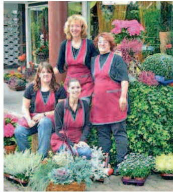
Das Team von Blumen Lenz-Petri

glied des Gärtnerlandesverbandes Rheinland-Pfalz an den Wettbewerben einer Bundesgartenschau und war schon bei seiner Teilnahme 2007 in Gera sehr erfolgreich. Neben den prämierten Pflanzen der BUGA bietet das Blumenhaus, das bereits in der dritten Generation geführt wird, eine Vielzahl unterschiedlicher Pflanzen, Sträucher und Bäume in einem großen Sortiment an. Darüber hinaus kreiert das Smedla-Team ausdrucksvolle Tisch- und Saaldekorationen für jeden Anlass, berät bei Balkon-, Terrassen und Gartenbepflanzungen und nimmt Kübelpflanzen in Pflege.